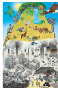
北アメリカ部門第1位