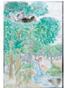
モニカ・アディアンボ ・アレゴ (14才、ケニア)